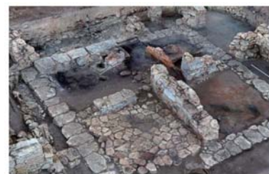
考古学での利用事例： 遺跡や発掘物の測量・モデル化などで威力を発揮

プロフェッショナル版 は、スタンダード版の機能に加え、マルチスペクトル画像処理、ダイナミックなシーン用の4Dモデリング、ネットワーク処理、Pythonスクリプト、距離・面積の測定、地上レーザースキャナーなどに対応しています。