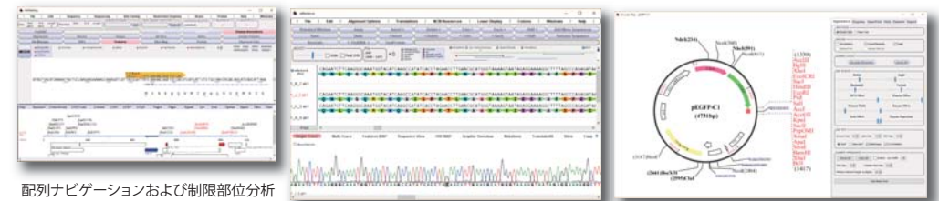
配列ナビゲーションおよび制限部位分析